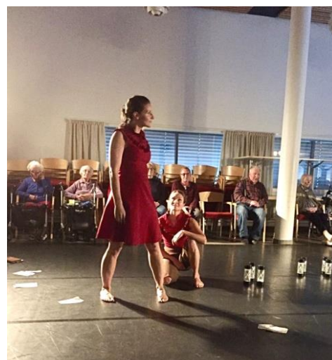
Foto: Grethe Brækkan, I wish her well av Panta Rei Danseteater, CODA

CODA+ har på kort tid blitt en sentral del av festivalens aktivitet, tett knyttet opp til verdien at dans er for alle. Det ble arrangert turné til to ulike sykehjem og eldresentre i Oslo med Panta Rei Danseteater og forestillingen I Wish Her Well . I tillegg ble det spilt to åpne matinéforestillinger på Trikkehallen på Kjelsås. CODA+ ble avviklet i september og fikk slik et større fokus enn tidligere år da det har blitt avviklet i forbindelse med festivalperioden. Under CODA+ programmet gjestet to britiske dansekunstnere fra Pavillion Dance South West turneen, som en del av et utvekslingsprosjekt med nasjonale og internasjonale samarbeidspartnere. Gjestene fikk i tillegg et møte med Nasjonalt Kompetansesenter for Kultur Helse og Omsorg (NKKHO), en åpen prøve og samtale med Ingun Bjørnsgaard Prosjekt og Koreografihuset ved DNO&B. Utvekslingen var støttet av NKKHO og Norges Ambassade i England.