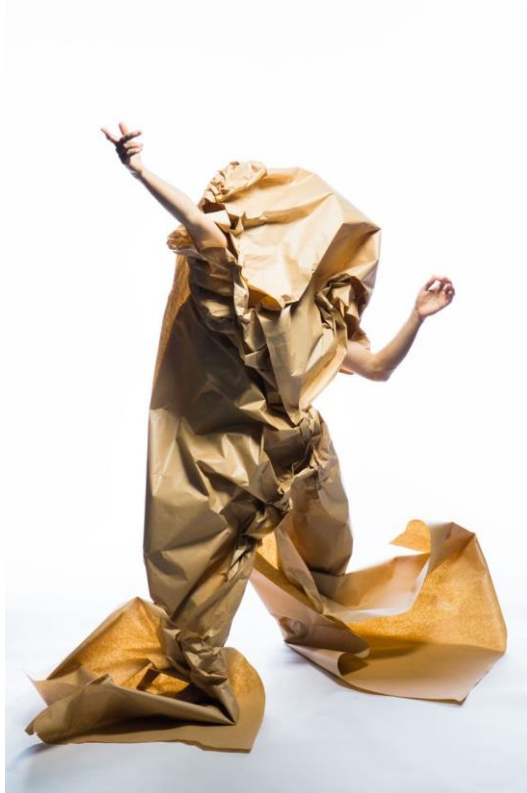
Unknown Pleasures av CCN Ballet de Lorraine

Administrativt støtteapparat Det administrative støtteapparatet har bestått av totalt 3,2 årsverk fordelt på fast ansatte og engasjement. I tillegg har CODA hatt en person i 40 % stilling i arbeidstrening gjennom samarbeid med NAV, frem til 21.11.17. Festivalen fikk ny leder i august/september. I forbindelse med kunstnerisk kurateringssamarbeid har en person vært tilknyttet festivalen frem til og med festivalperioden. I oppkjøring og avvikling til festival ble staben økt fra 3 til 5 personer, et teknisk team og opp mot 90 frivillige.